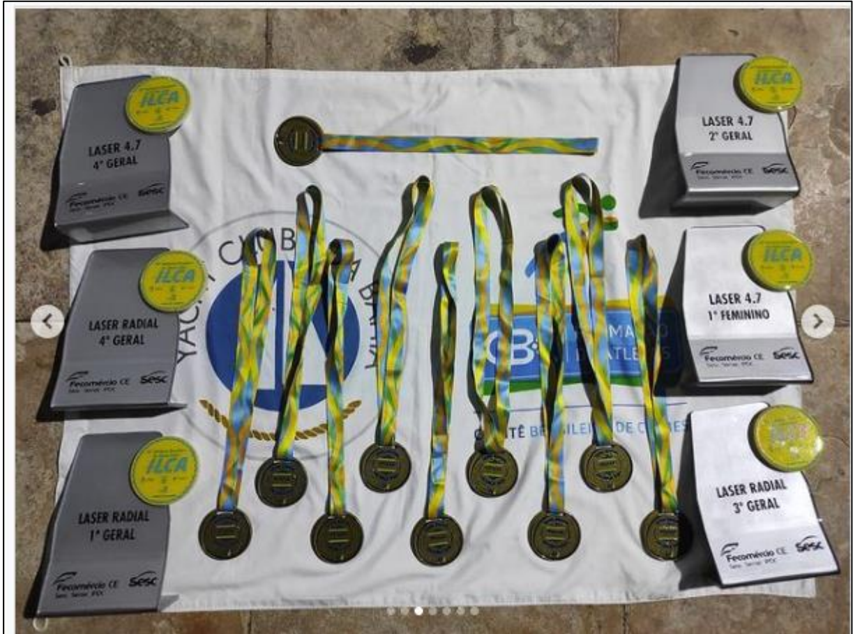
Premiações da I Copa Brasil de Vela de Praia em Fortaleza