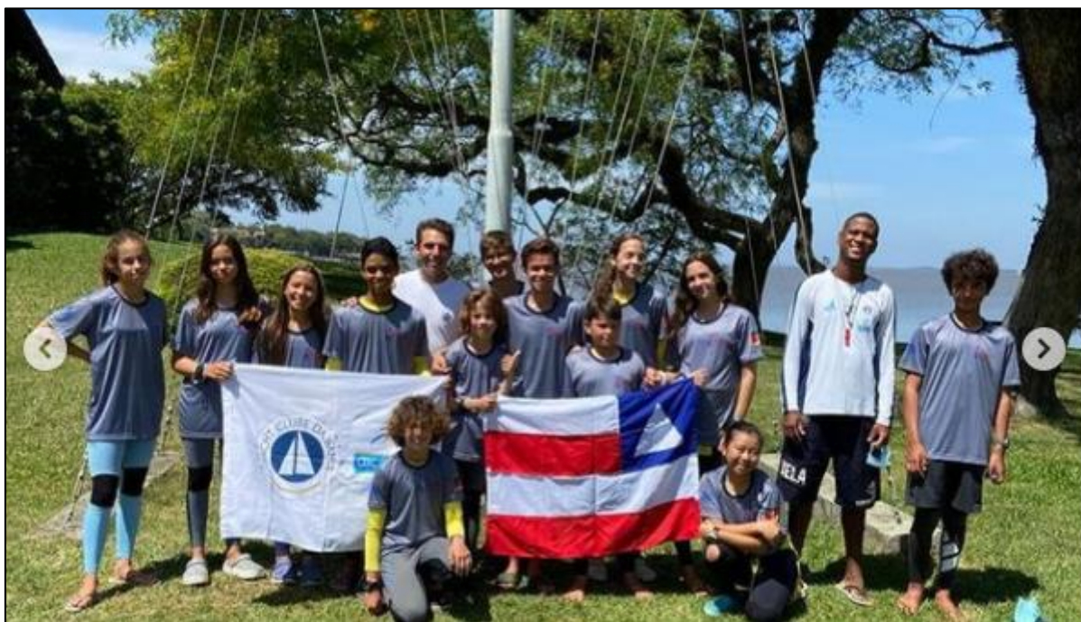
Atletas no 43º Sul-Brasileiro de Optimist