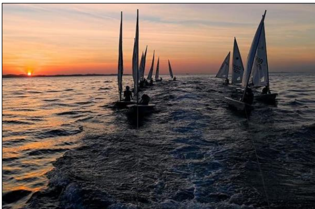
Treino dos atletas do clube