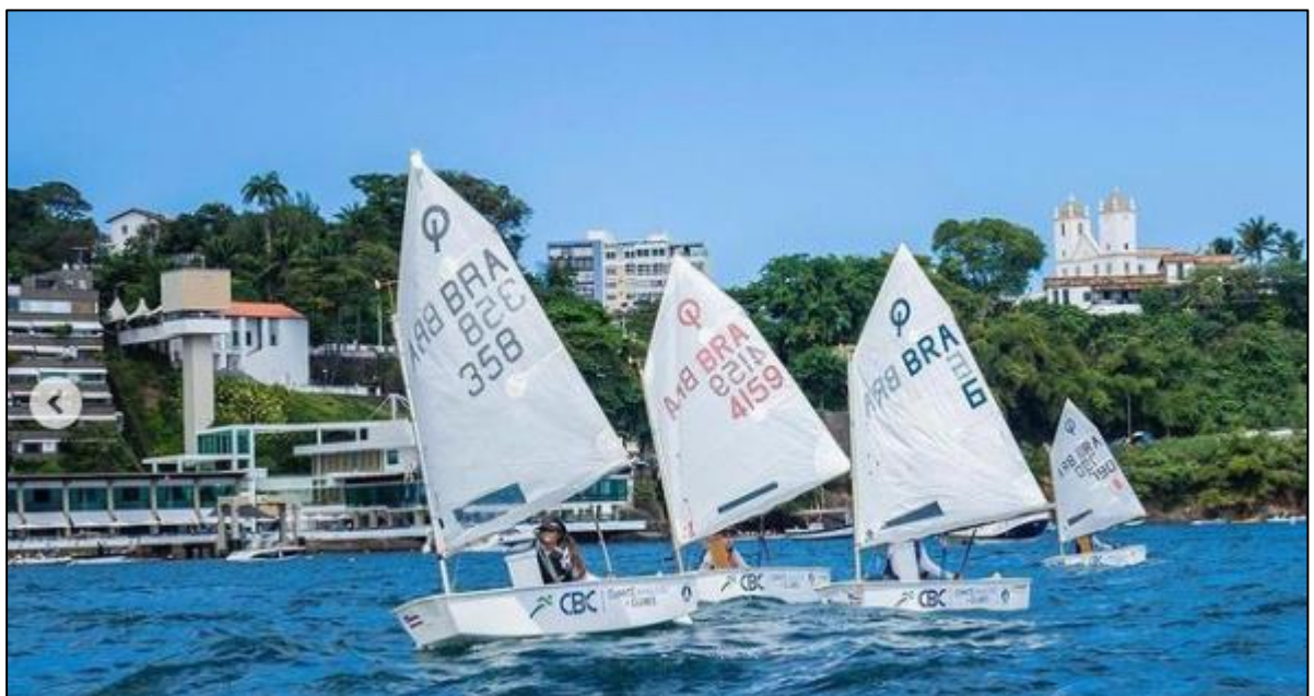
Treino dos atletas no clube