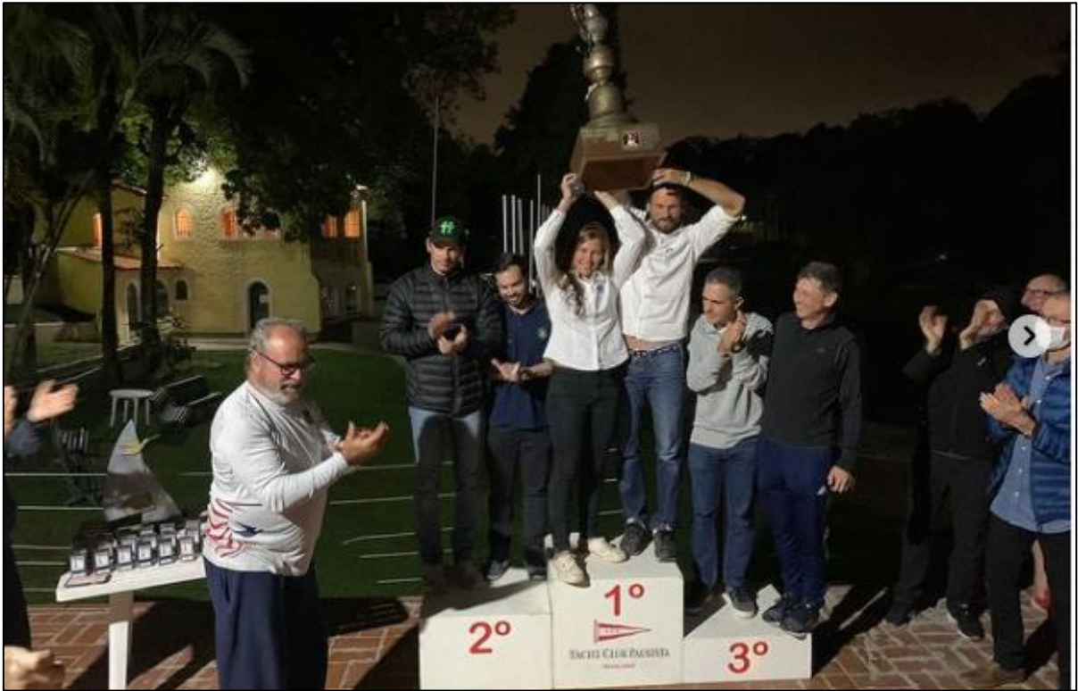
Pódio no 68º Campeonato Paulista de Snipe