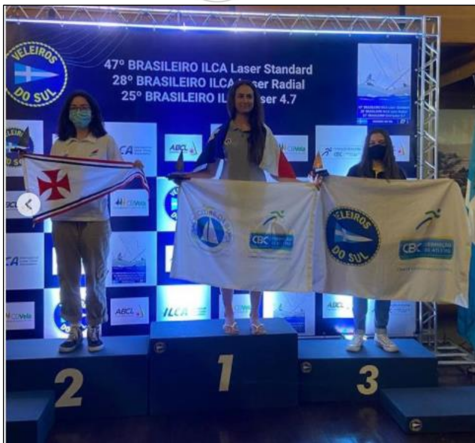
Pódio do 47º Brasileiro de Laser