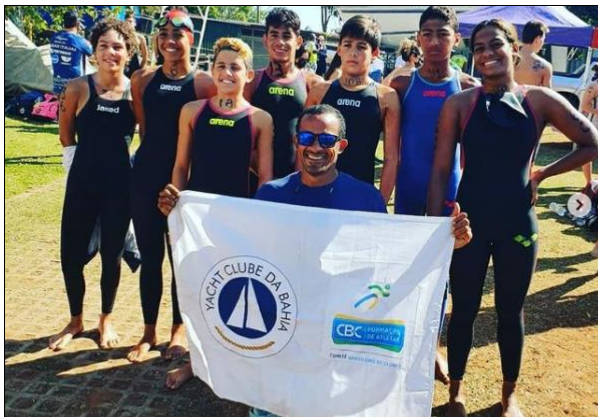
4ª etapa do Campeonato Brasileiro de Maratonas Aquáticas