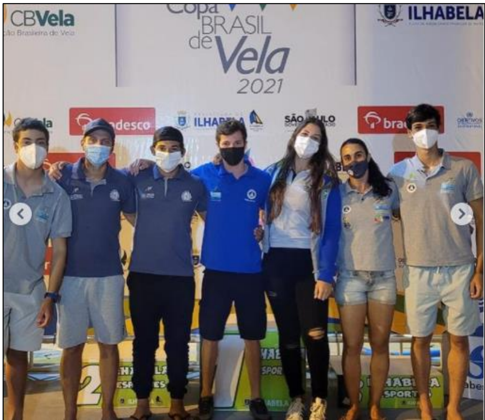
COPA BRASIL DE VELA 2021 – VII Copa Vela Jovem