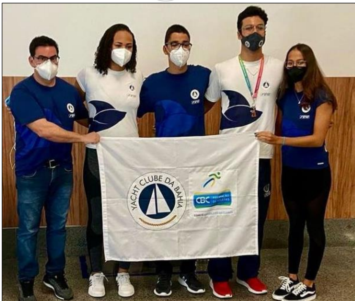
A Equipe Juvenil do Yacht Clube da Bahia rumo ao Campeonato Brasileiro Juvenil de Verão.