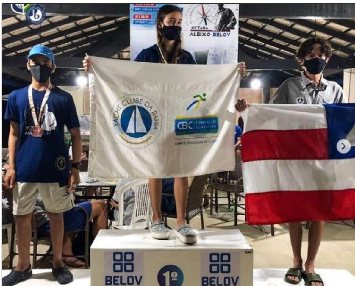
Premiação na Taça Aleixo Belov