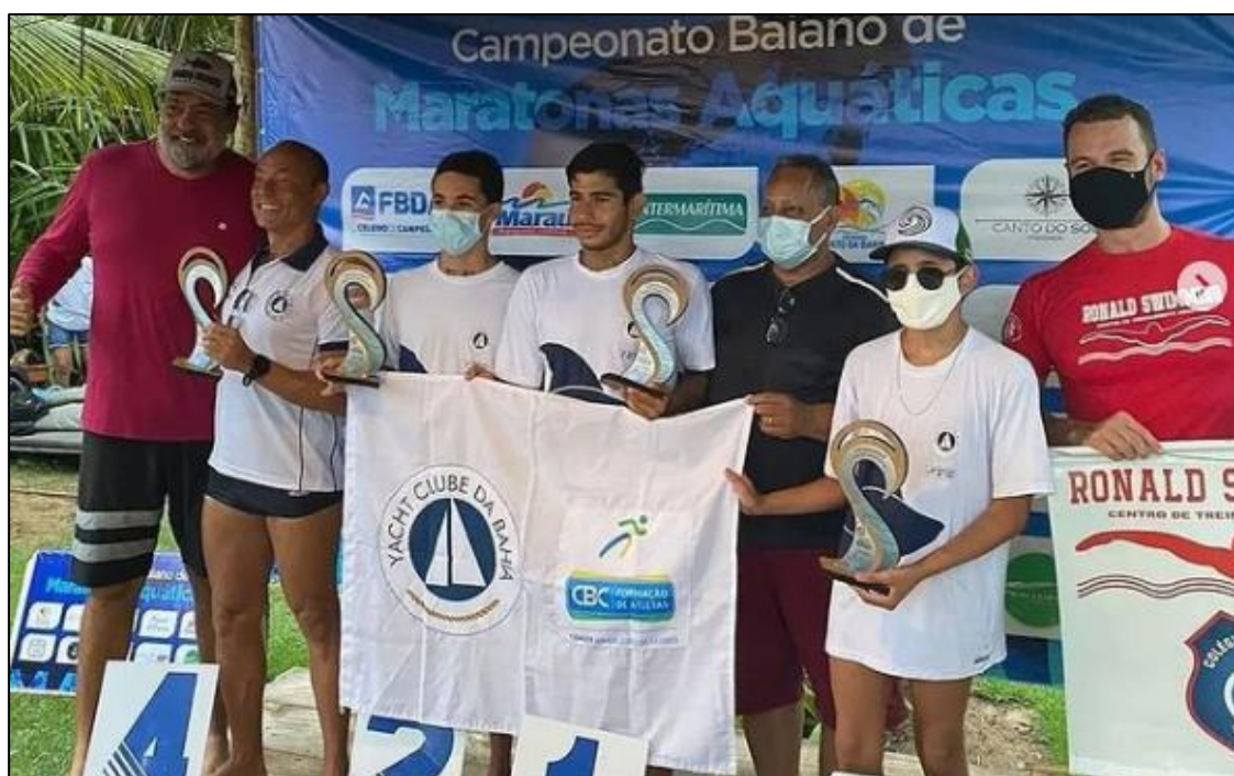
4ª etapa do Campeonato Baiano de Maratonas Aquáticas