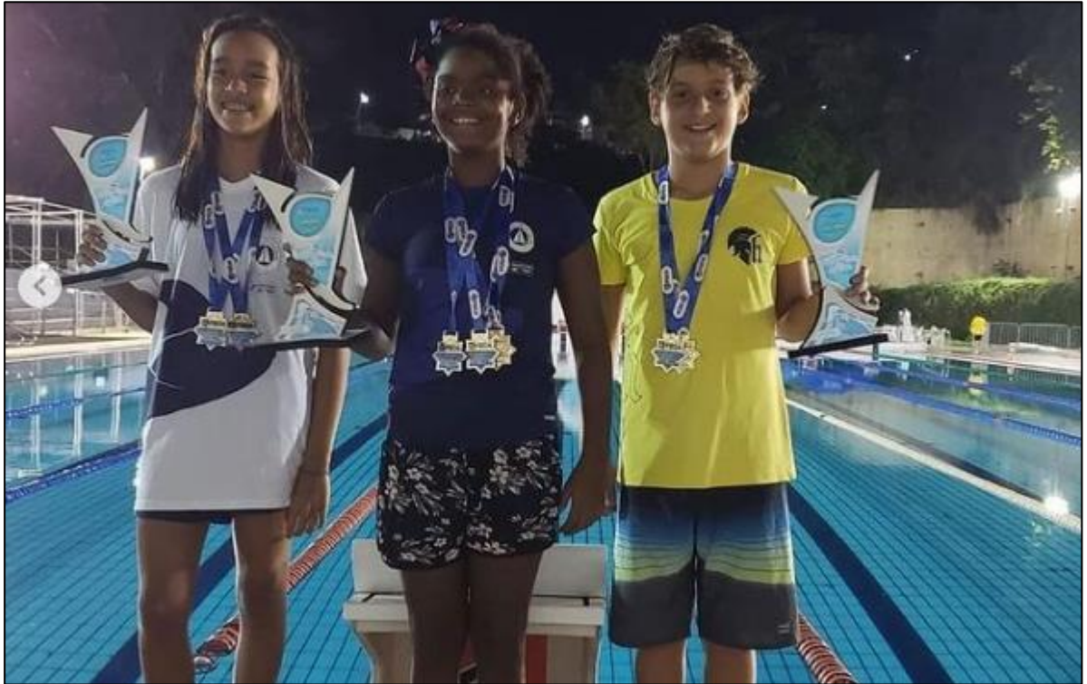
Troféu FBDA 68 anos