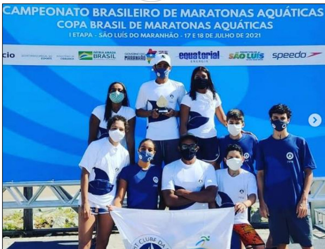
Primeira etapa do Campeonato Brasileiro de Maratonas