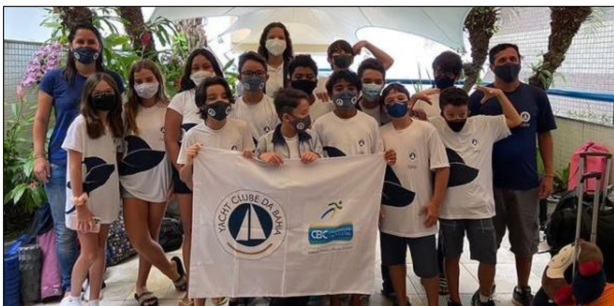
Rumo a Maceió para disputar o Festival N/NE Mirim e Petiz de Natação - Trf. Kako Caminha