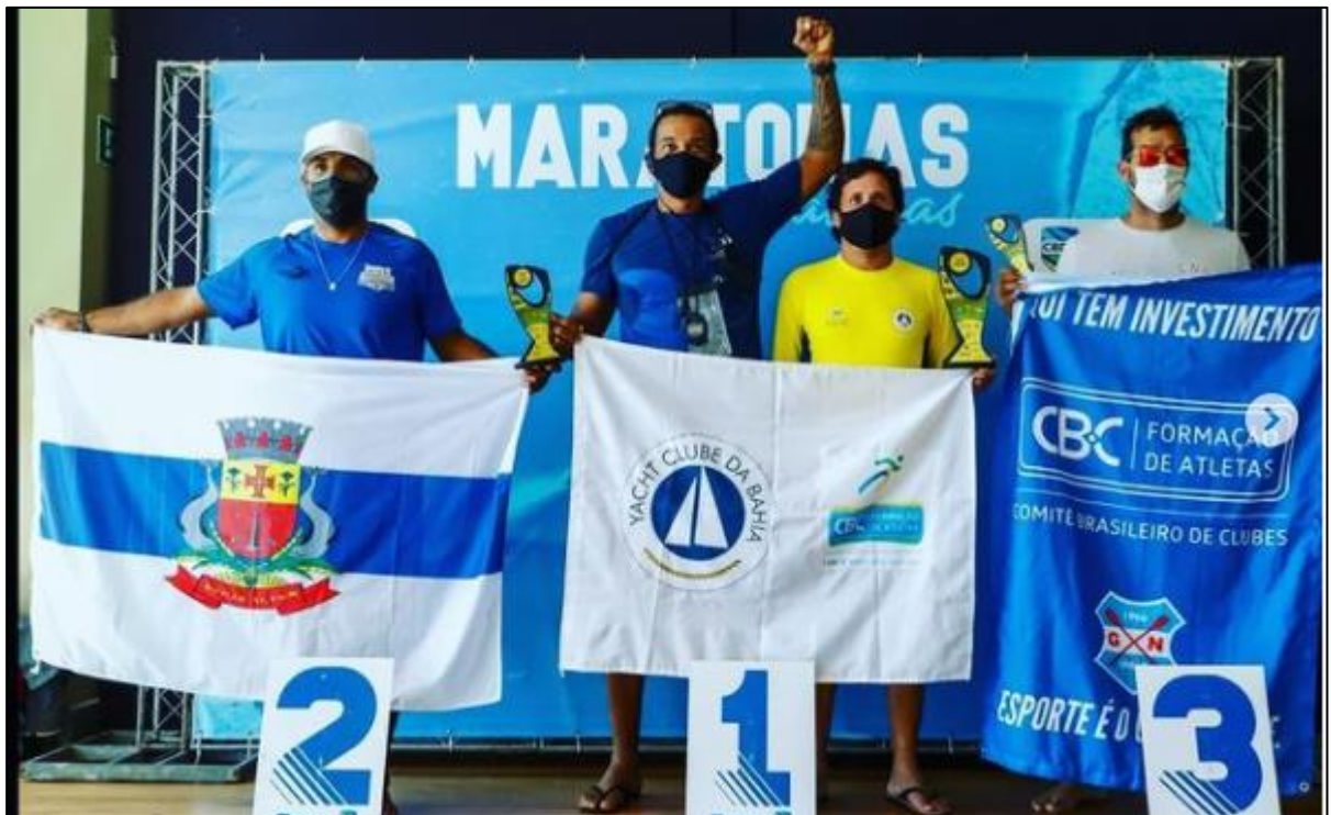
2º etapa do Campeonato Brasileiro e Copa do Brasil