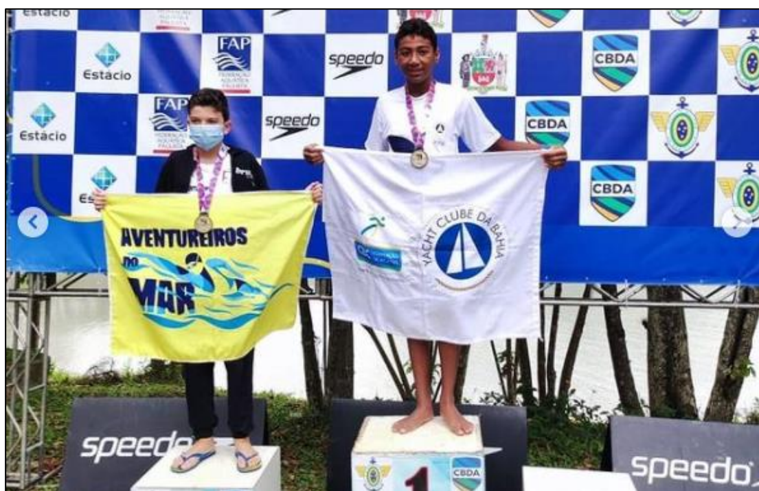
Campeonato Baiano de Maratonas Aquáticas